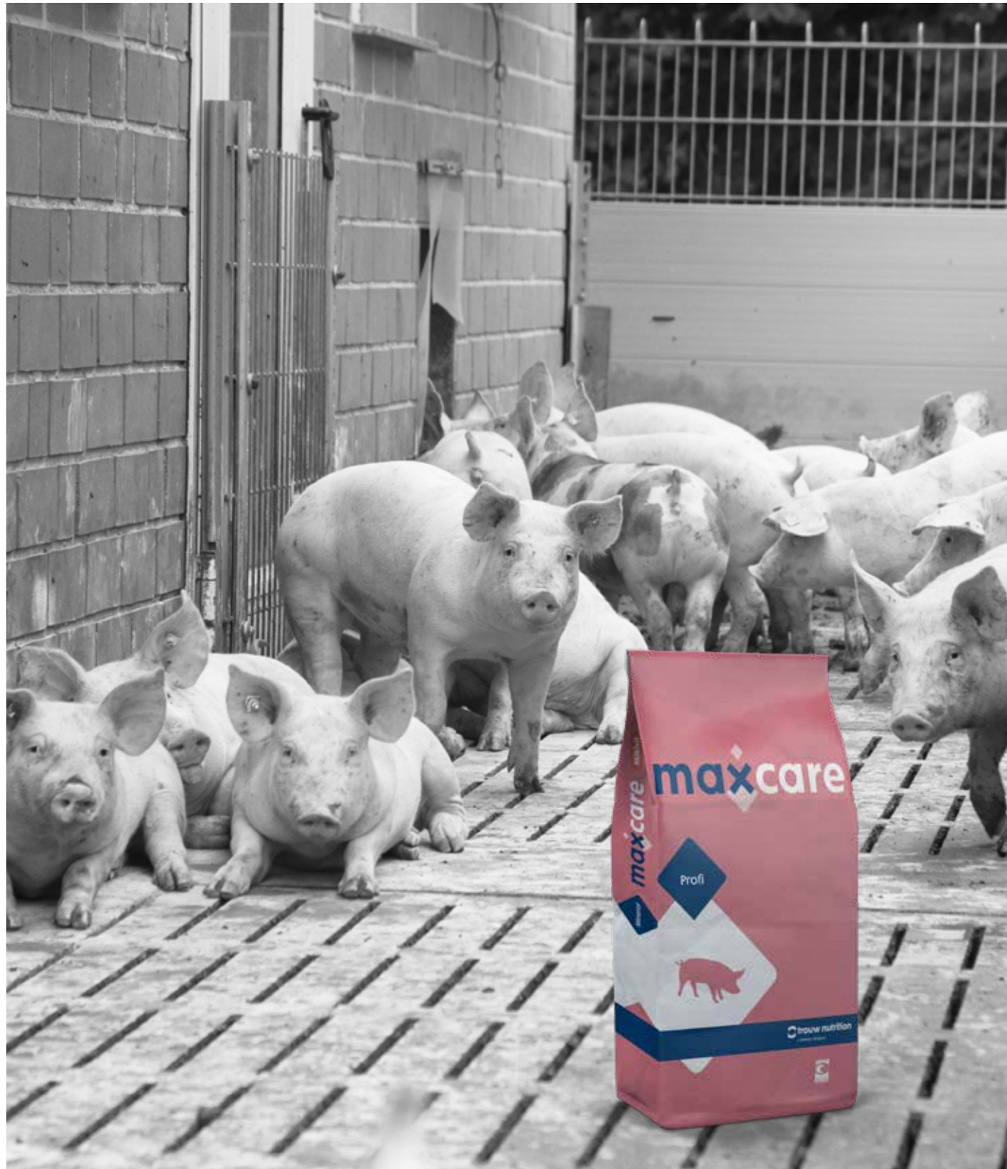
Rössler Consult • 09/20 • 539

Stand 1.10.2020. Änderungen vorbehalten.